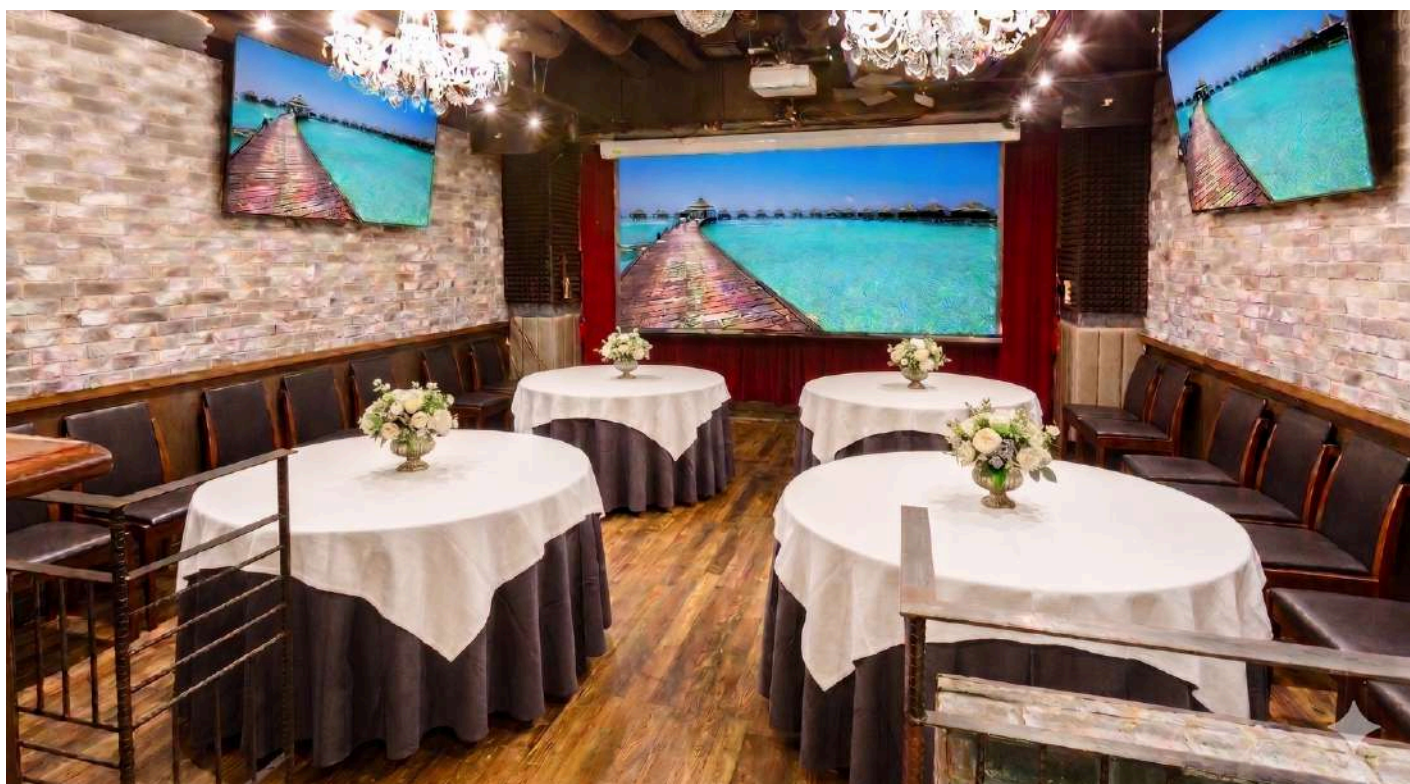
半立食スタイル Semi Standing Reception Style