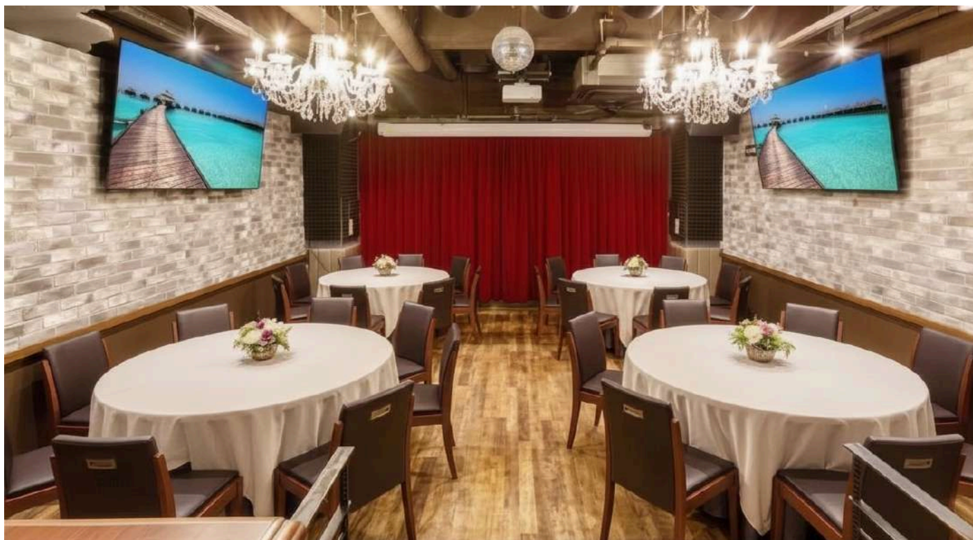
着席スタイル Seated Banquet Style

GRACE BALI SHIBUYA Alona Annex - B1 Floor